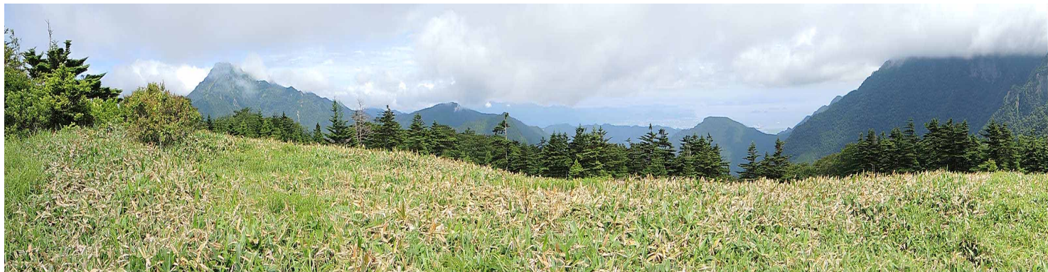
▲ 伊吹山からのパノラマ